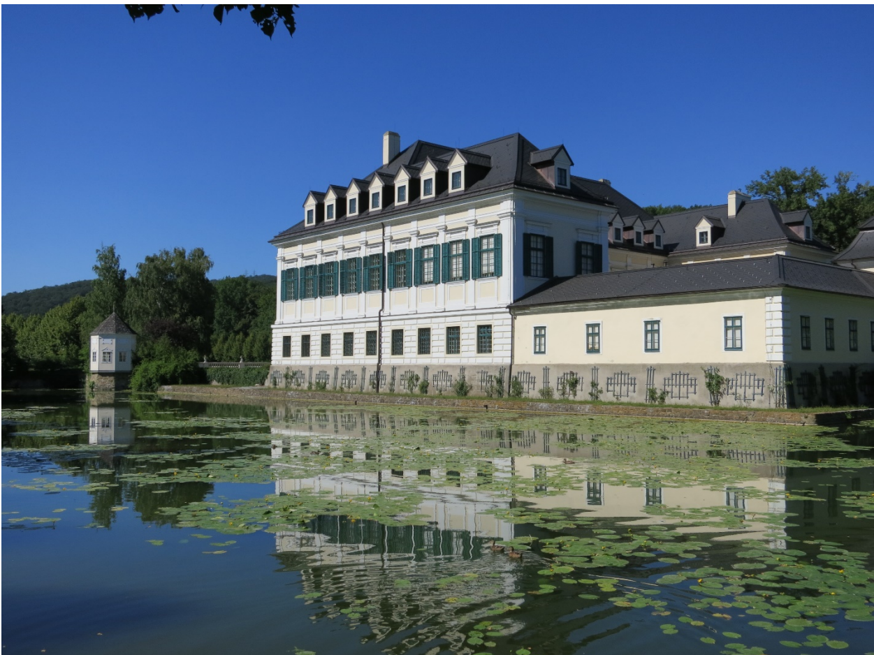
z.B. im Schulungszentrum Schloss Laudon

Wir schulen in Ihrem Betrieb , in unserem Bildungszentrum in Korneuburg oder in einem Seminarhotel Ihrer Wahl österreichweit.