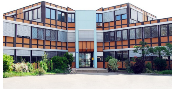
Unsere Firmenzentrale in Korneuburg